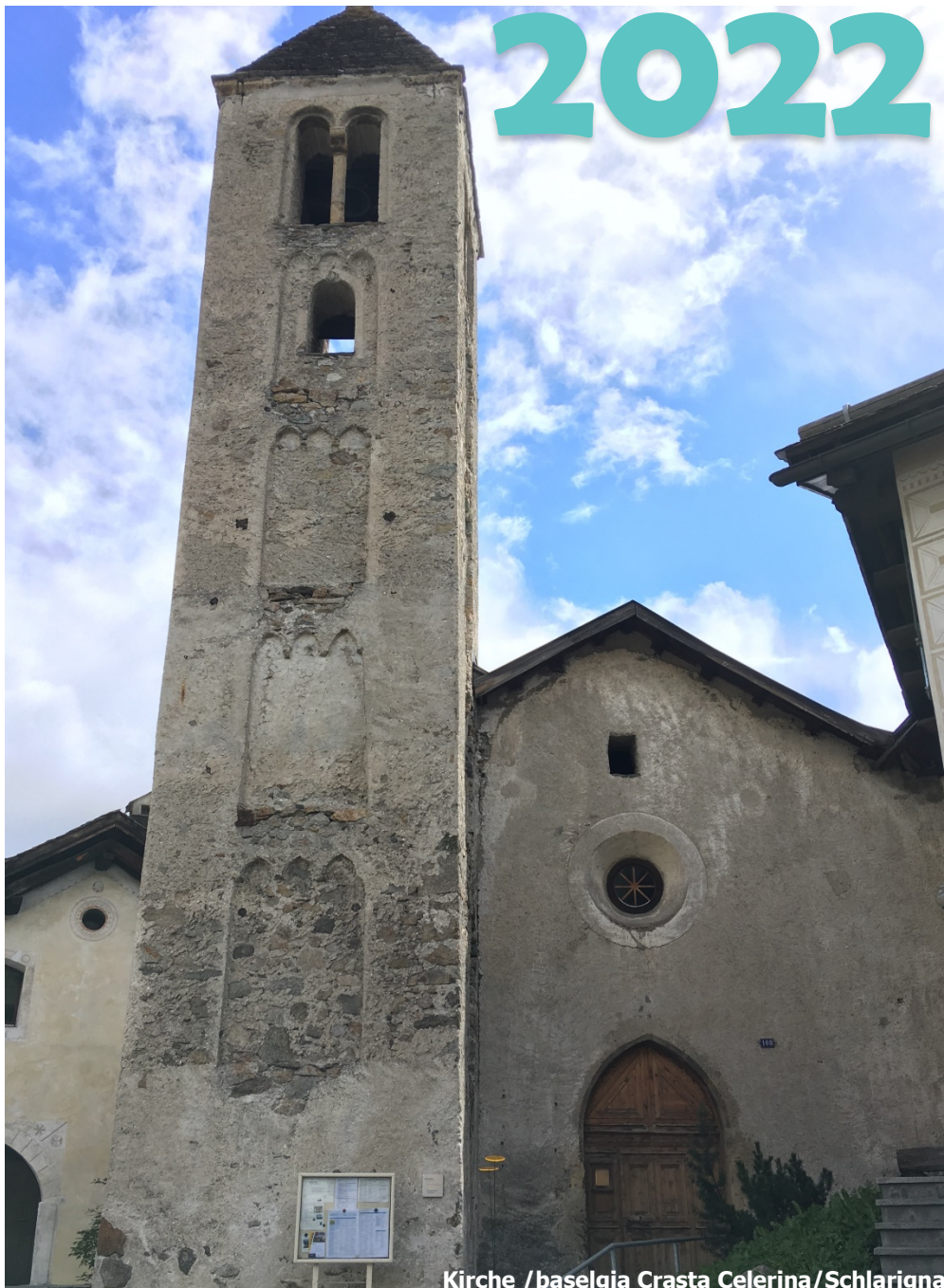
Kirche /baselgia Crasta Celerina/Schlarigna